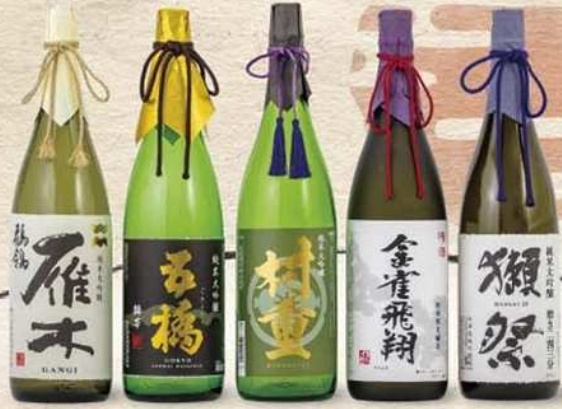
雁木 五橋 村重 金雀 獺祭 八百新酒造 酒井酒造 村重酒造 堀江酒場 旭酒造